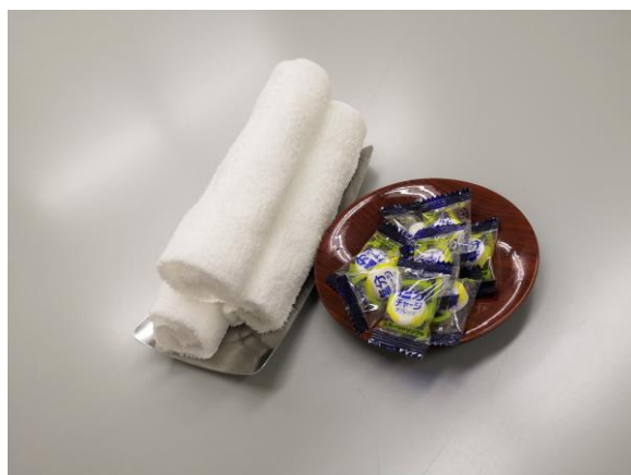
冷たいおしぼりと塩タブレットをプレゼント