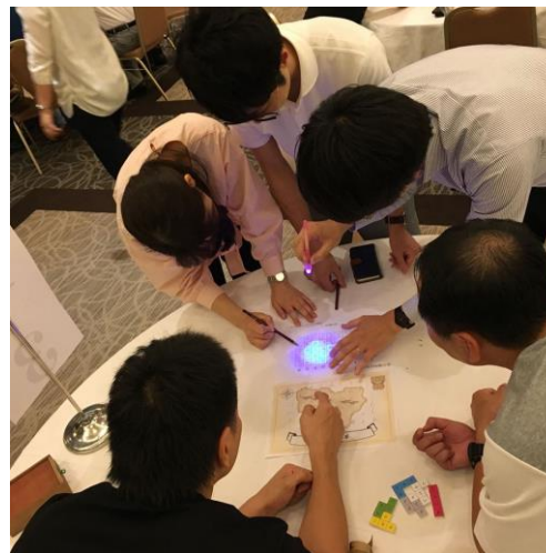
大人も本気の「謎解き」で大盛り上がり

当会議室は多くの企業様にご利用いただいております。中でも研修としてお使いいただく例が多くございます。当社は「体験型脱出ゲーム」の常設店「TokiToki escape café」も運営していることから、「謎解きゲーム」により得られる効果は、研修やチームビルディングに非常に有効であるのではないかと考えていました。昨年、常連企業様から「研修に謎解きゲームを取り入れたい」という要望をいただき、オリジナルの謎解き研修ゲームを作成し提供したところ、研修開始前の参加者の反応は「謎解きってなに？」というものが大半でしたが、いざ研修が始まるとヒントを探しに会場内を探索したり、チームで役割分担し課題解決したり、予想以上の盛り上がりを見せました。参加者からは「面白かった」「印象に残る研修となった」「発想の転換の重要性を理解した」「話したこともないメンバーでもすごく仲良くなれた」などご好評の声をいただきました。「謎解き研修」を取り入れることで、短時間で個性や能力を見出すことができるのではと考え、今回のプランを作成いたしました。