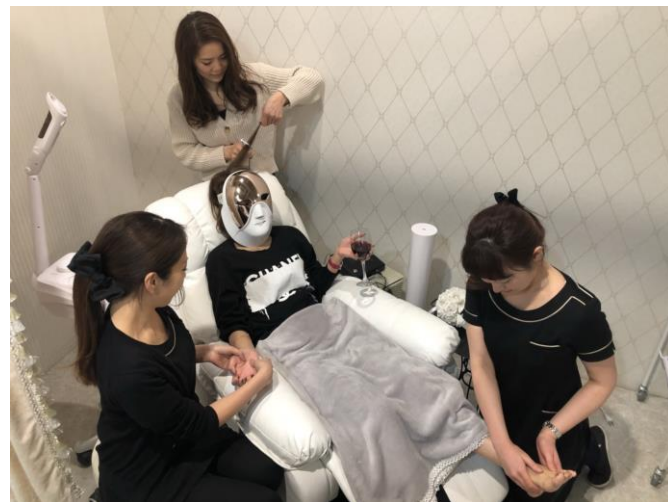
お客様は寝ているだけで施術を完了いたします

当社といたしましては、忙しい現代の女性のための進化系サロンとして根付いていけたらと思っております。