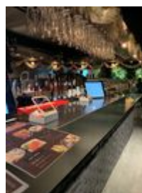
受け渡しカウンター