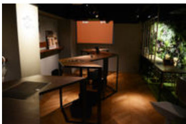
4つの空間 -Sana- 「健全な癒やし」