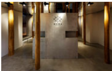
中世ヨーロッパの「村」をモチーフにした 店内