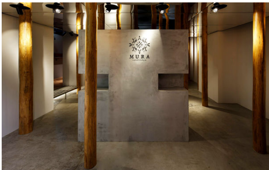
中世ヨーロッパの「村」をモチーフにした店内

2018年12月のテストオープンから、実際に店舗を営業しながらお客様の注文動向や動線等を詳細に分析し、シミュレーション時には発見できなかった不具合の修正などを重ね、システムの安定性が向上したことで、グランドオープンとして本格稼働いたします。