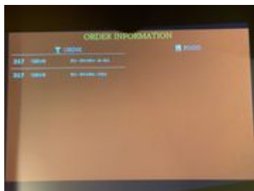
出来上がったオーダーは店内の大型スクリーンで確認も可能