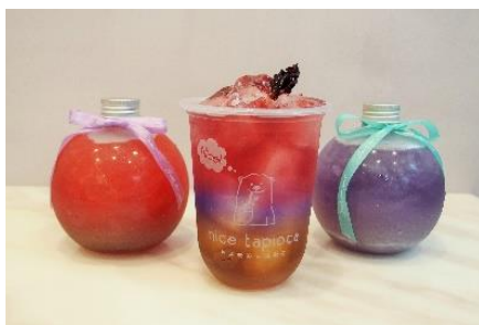
台湾で流行中の「星空ドリンク」 550円～