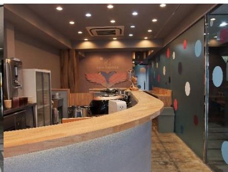
水色とピンクを基調に仕上げた店内はファンシーな雰囲気