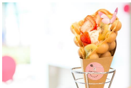
ポコポコとした見た目が特徴の香港名物 「エッグワッフル」4種400円～ トッピングも4種用意