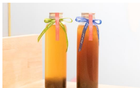
スタイリッシュな約30センチの ロングボトル容器も用意しております