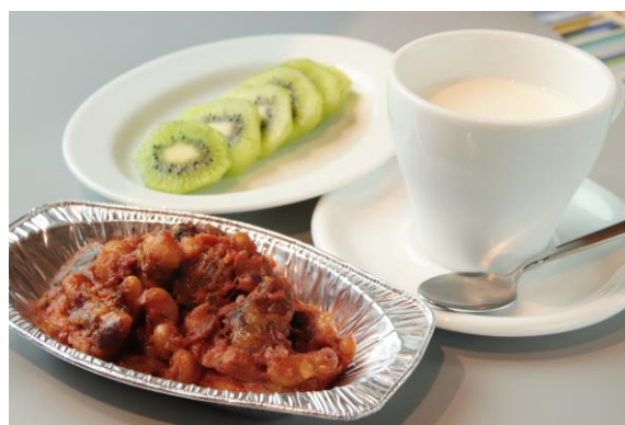
安眠効果のある3つのメニュー