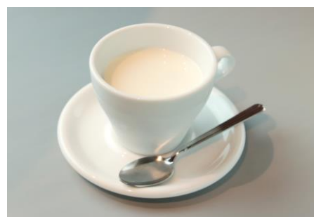
ホットミルク 200円（税抜）