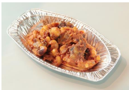
お肉とインゲン・レンズ豆のトマト煮込み 480円（税抜）