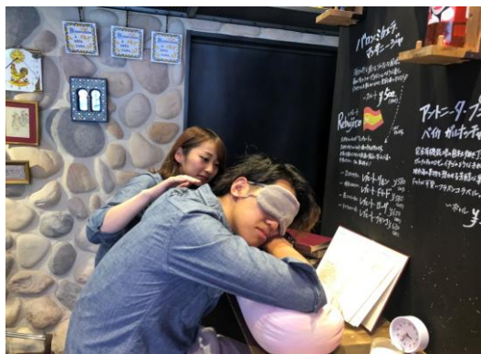
スペイン語で優しく起こされる様子

スペインには昼食後に短い睡眠をとる「シエスタ」の習慣があります。疲労回復だけでなく、その後の仕事効率のアップなどの効果が期待されることから、企業でも取り入れるところが増えています。本場スペインの雰囲気味わえる当店でも、ぜひシエスタを導入したいとの思いから、今回 安眠効果があると言われているキウイ、ホットミルク、レンズ豆を使った特別メニューに耳栓、枕、アイマスクの安眠グッズの貸し出し を付けた「シエスタ付きメニュー」を企画いたしました。寝つきの悪い方のために、 眠たくなる本 もご用意しております。より本場の気分を味わっていただけるよう、希望者は スタッフがスペイン語で優しく起こすサービス も行っています。当店はオフィス街にも近いことから、ランチ後や合間の時間にお立ちよりいただき、気軽にシエスタを取り入れていただきたいなと思っております。