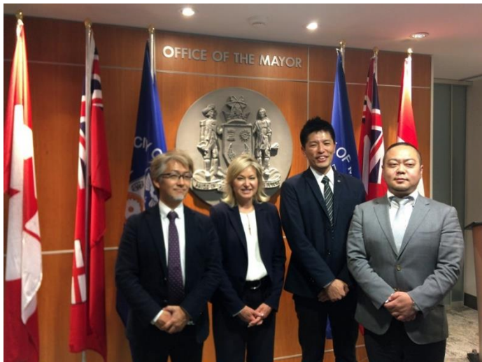
カナダ・ミシサガ市長とご挨拶も行いました