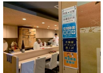
店内にステッカーを貼付

当社としてはコロナウイルスはもちろん、ウイルス全体に対する意識を変えていくことを目指し、除菌の意識は本人だけでなく第三者の意識も必要だと考えたことから、お客様の推薦加盟店というものを発案しました。より多くの店舗や施設にご加盟いただき、安心して過ごせる世の中にしていけたらと考えております。