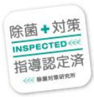
除菌対策指導認定済 ステッカー