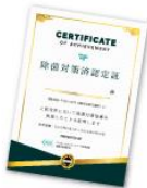
除菌対策済認定証

当研究所ではこうした施工サービスのほか、加盟店制度を設けております。当研究所へ加盟いただくことで、国の感染対策の原則に基づいた独自の除菌対策研究所プログラムでの指導を受けていただくことが可能になります。また、ウイルスや菌からの感染・除菌対策に取り組む加盟店には、 日本初の集団感染発生時の駆け付けサポートや、除菌対策済認定証・除菌対策指導認定済ステッカー（1枚300円）の特典付き で、ステッカーなどは店舗に貼付することでお客様に安心してご来店いただくことができます。