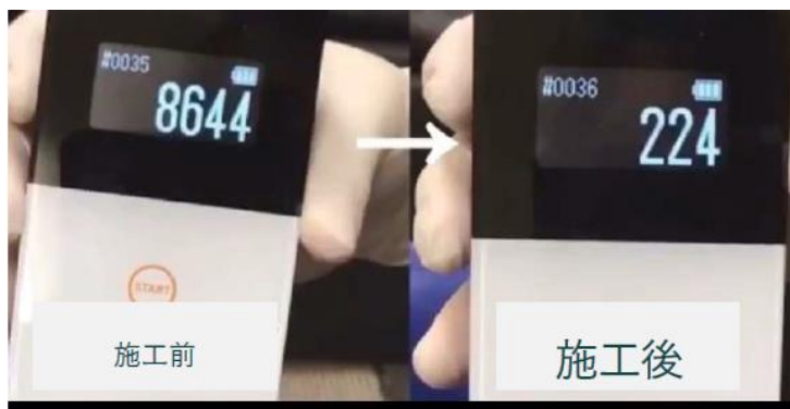
施工前・施工後の数値の差