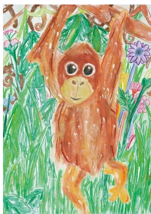
【小学生部門】 不思議の森のオランウータン