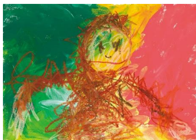
【幼児部門】 きみと森のカラフル