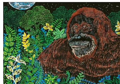
【大人部門】 森と共に生きるオランウータン