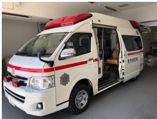
堺市消防局の救急車の内部に装着しました

当社では新型コロナウイルス感染症の感染拡大防止のため、救急隊への感染防止が急務と考え、救急車内に設置する感染防止用カーテンを2セット製作し、2020年5月21日に堺市消防局に寄贈しました。チャックを装備しており、最小限の接触でコロナ疑いのある患者を安全に搬送することができます。救急車への取り付け費用を含み、22万8,000円（税別）で販売をいたします。