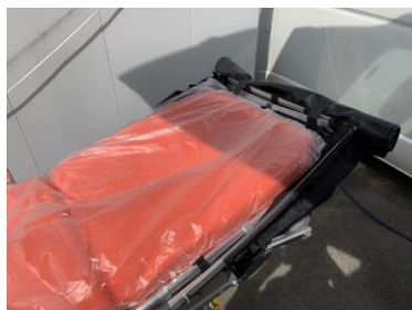
カバーを収納した状態

今回第2弾として開発したストレッチャーカバーは、救急車に患者を乗せる際に使用するストレッチャーに装着する顔面部分のカバーです。開け閉めができるため必要に応じて使うことができます。