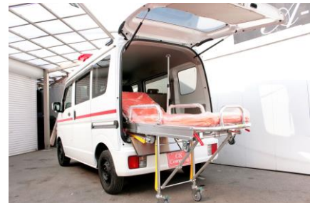
救急搬送車。主に病院間の患者の搬送に使用します。ストレッチャーや酸素ボンベなども装備しています（左） ストレッチャーの代わりに車いすを搭載することもできます（中）。軽自動車の救急搬送車も販売しています（右）