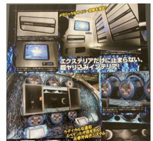
カスタムカー製作の技術を 生かしています