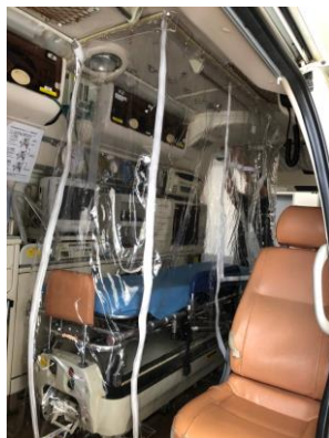
チャックを開け閉めすることで、患者との接触を最小限に抑えます