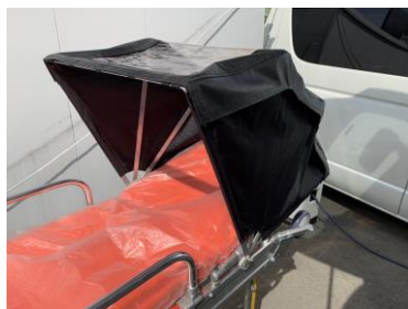
カバーを開けた状態。周囲を黒色の布で囲むため患者のプライバシーを守る一方で、上面が透明のため救急隊員は患者の様子を見ることができます（左） 全身をカバーするビニールも装着できます（右）