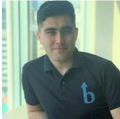
ユルチヴ アボスベク

まずは日本の夜勤をカナダで運営していくことが最初のステップですが、単純な夜勤のシフトではなく、時差を利用して昼間と変わらない体制を整えることで、真の意味での「24時間365日変わらない品質とスピードのMSPサービス」をお客様に提供していくことがビヨンドの目標です。