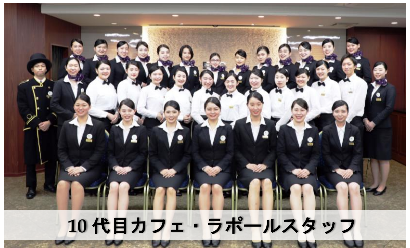
10代目カフェ・ラポールスタッフ