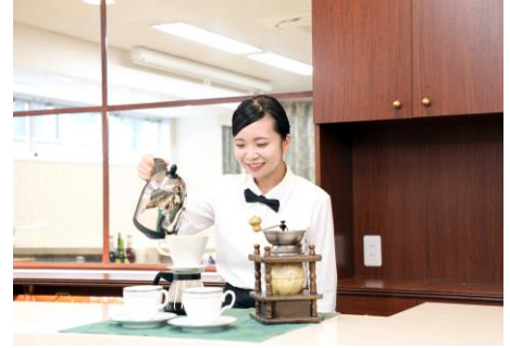
大阪新阪急ホテルメイドのパウンドケーキと4年連続モンドセレクション最高金賞受賞の「ふくしまの水」を使用した「ふくしまコーヒー」をお楽しみください。