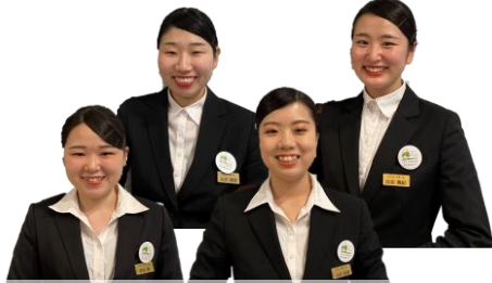
皆様へ、安心の空間を提供いたします！ 衛生管理課スタッフ