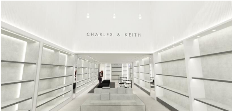
CHARLES & KEITH心齋橋筋店 内観イメージ