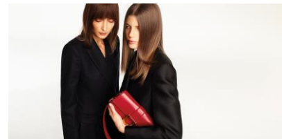
Spring Summer2021 ビジュアルイメージ

是非、貴社媒体でお取り扱い頂きますようお願い申し上げます。何かご不明な点がございましたらお気軽にご連絡くださいませ。