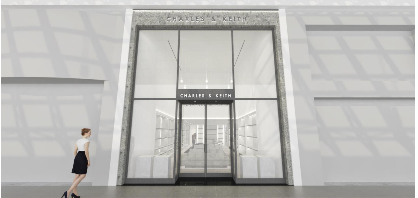
CHARLES & KEITH 心齋橋筋店 外観イメージ