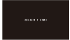
オープン時ノベルティ マスク+マスクケース イメージ