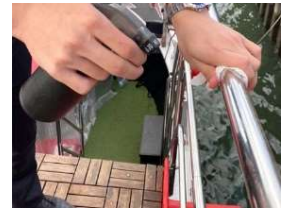
船内設備は随時消毒