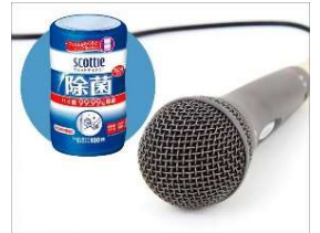
備品は使用ごとに除菌