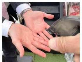
乗船時の手指消毒