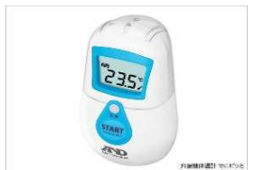
37.5度以上は乗船不可