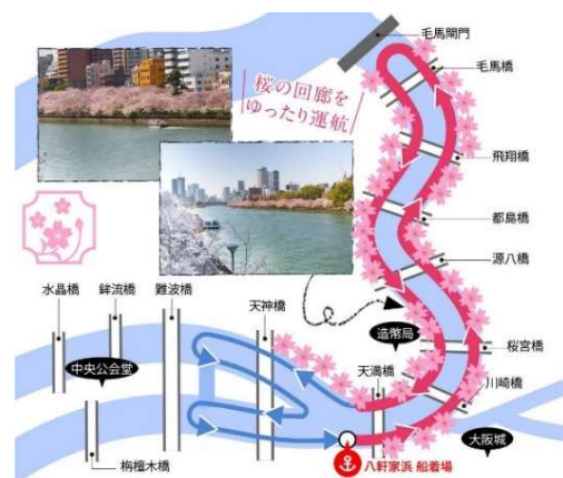
お花見クルーズ 運航コース