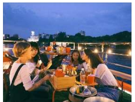
21時以降の運航を中止

下船時刻が21時を超えるクルーズの運航(出航が19時1分以降)を中止しております。 また、20時30分以降は酒類の提供を休止させていただきます。