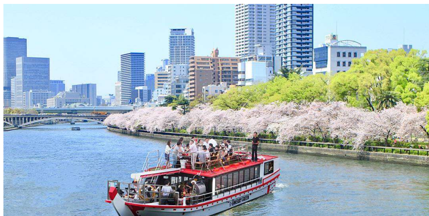
大川沿いの桜並木を、貸切クルーズで密を避け楽しむ

株式会社One Osaka リバークルーズ(本社:大阪市北区堂島1-1-25、代表取締役:堀感治)が運航する、グランピング船「MERRY GREEN(メリーグリーン)」の貸切お花見クルーズは2021年4月15日(木)まで、ご乗船されるお客様を対象に、オプションとして新型コロナウイルスの抗原検査キットを1,100円(通常価格4,180円、送料別)でご提供いたします。事前に自宅で検査をしてから乗船することで、安心してお花見クルーズをお楽しみいただきたいと思います。