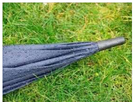
雨の場合は2日前まで無料キャンセル

降雨による屋外デッキ使用不可の場合「無料」でキャンセル対応します。 日本気象協会の天気予報専門メディア「tenki.jp」が発表する大阪市中央区の3時間天気予報で、前々日12時の時点で翌々日(乗船日)9:00~21:00のご乗船時間で降水確率50%以上の場合に適用されます。 ※ご乗船2日前までのキャンセルに限ります