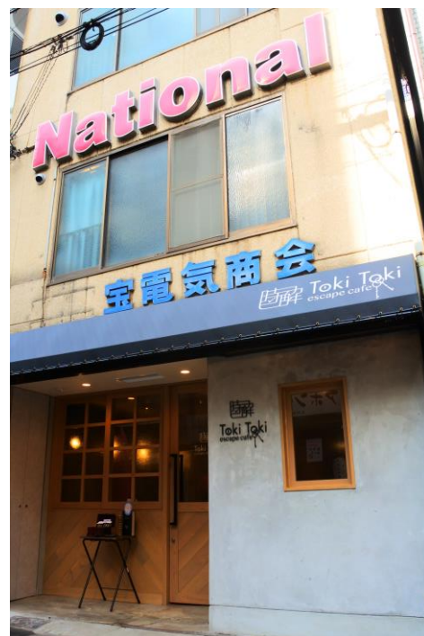
当時の面影を残す外観

座裏にはおしゃれな店から個性的な店までが立ち並び、客層もサラリーマンから若い女性まで幅広く、唯一無二の雰囲気漂わせています。当社としましては、その独特な雰囲気を残す座裏の新たな遊びスポットとして認知を広めるだけでなく、近隣の会議室やホテルと「謎解き研修」「謎解き宿泊」を企画するなどエリアのにぎわい創出に貢献出来たらと考えています。