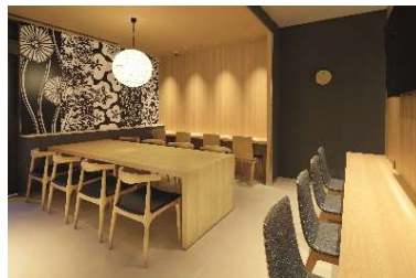
Wi-Fiを完備したラウンジ