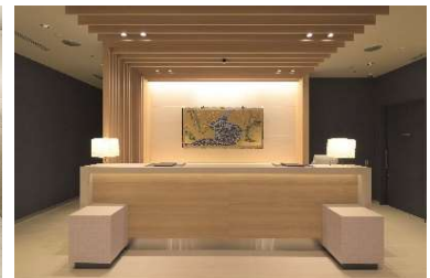
「和」をイメージした内装