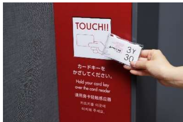
安心のセキュリティー

館内は男性専用と女性専用エリアに分かれおり、入り口でセキュリティーカードをかざして入場するため、女性お一人でも安心して宿泊いただけます。当施設は簡易宿所となるため法令上キャビンに鍵をかけることはできませんが、キャビン内に施錠可能なセーフティーボックスを設置し、大型の荷物はキャリーケース置き場やフロントでも無料でお預かりします。全館に無料Wi-Fiを完備しており、フロントには最新のフライト情報を掲示しています。食事などに利用いただけるラウンジや、旅の疲れを癒す大浴場やシャワーブースはデユースのお客様もご利用いただけます。大阪の「空の玄関口」である関西国際空港に直結することから、フロントやラウンジの内装は「和」のイメージで統一しています。