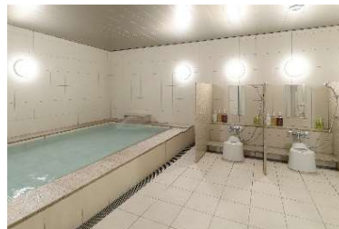
旅の疲れを癒す大浴場