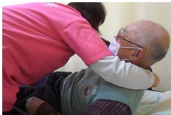
見た目は普通のTシャツ 鉱石が入った特殊プリントを施した「リライブシャツ」