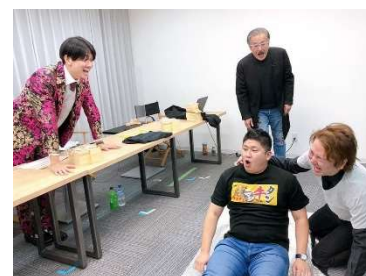
効果に驚く投資家たち

第3話 https://www.youtube.com/watch?v=lqQmq-sm8k8