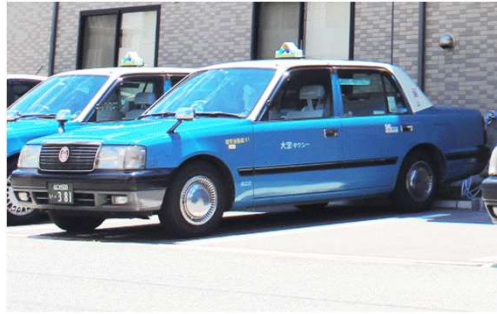
大宝タクシーの車両