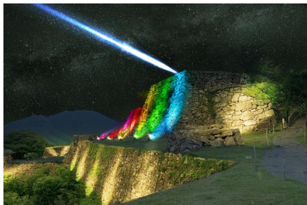
天守台から希望の光を放ちます

兵庫県朝来市は11月3日～30日の間、国の史跡に指定されている「竹田城跡」をライトアップするイベント「天空（そら）まで届け、希望の光 竹田城跡 夜の特別ライトアップ-YELL LIGHT-」を開催します。期間中は、虹色、青、緑、赤など、色とりどりの光で竹田城跡を照らし、医療従事者など、様々な活動に取り組まれる方々へエールを送るほか、天守台から夜空へ向けて未来を照らす希望の光を放ちます。