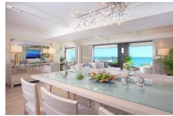
1つのフロアに1室のみ、各部屋 200㎡を超える贅沢なつくり