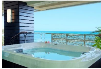
ワイキキビーチに臨む、各部屋の ラナイに備え付けのジャグジー