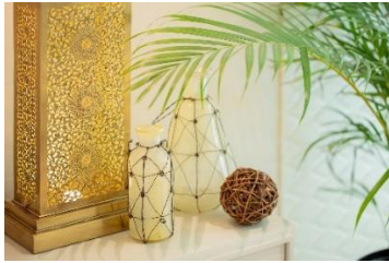
クラフトマンシップ溢れる こだわりのモロッカランプ