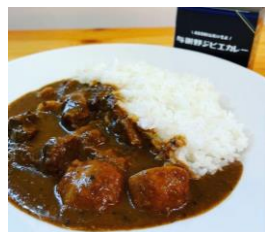
共同開発のジビエカレー（関学）