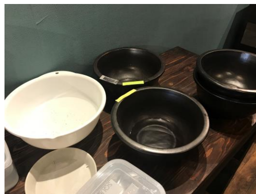
病気のメダカを回復させる塩浴スペース