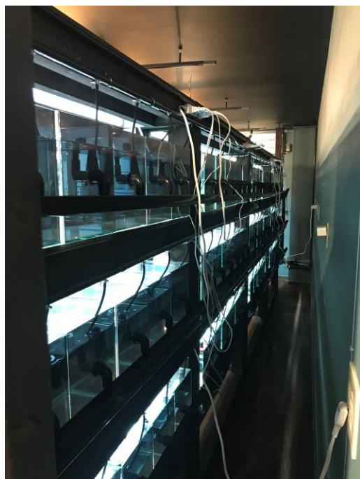
水槽の裏には水を24時間循環させる装置