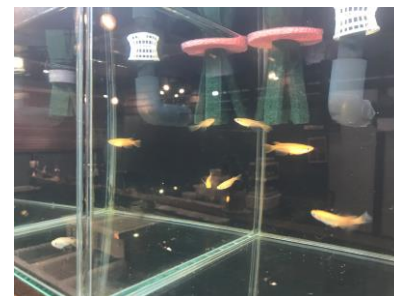
人気の高まる改良メダカ

就労継続支援A型は雇用関係を結んでいるのが特徴で、県の最低賃金（2023年4月現在、960円）を必ずお支払いしています。改良メダカについてはカラフルな見た目や飼育のしやすさなどから注目され、コロナ下で需要が急増。 そのため、メンバーへ給料として還元しやすく、さらに動物と触れ合うことによって精神的なやすらぎを得られるというメリットもあると考えこの業態を選びました。 今年1月から開店準備のためにメンバーに働いてもらっていますが、休む日が減ったり、いつもより長時間働けたりするなど効果を実感しています。