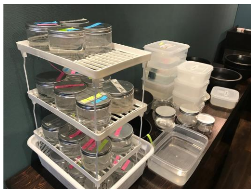
採取した卵を育てるスペース