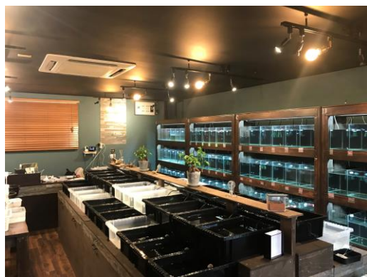
カフェのような店舗づくり