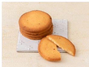
泉州玉ねぎサブレ

富田林市のおおきにアグリさんが育てた大阪レモンをつかったロールケーキ。皮まで食べられる安心安全なレモンをめざして、栽培期間中は農薬・肥料不使用の自然栽培をおこなっています。 販売期間：2023年6月2日(金)から新発売。数量限定、なくなり次第終了。