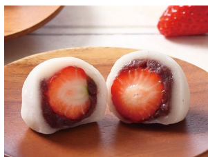
九度山いちご大福

泉佐野市の射手矢農園の「泉州プレミアムたまねぎ」を使った香ばしいサブレ。農作物や水産品など、大阪で豊かに獲れる食材や、それらを活かした商品として「大阪産(もん)」に認定されています。 販売期間：通年