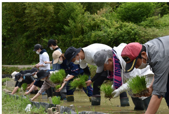
手作業で田植えを行う（昨年の様子）

■地元・泉佐野のもち米を使った最中で地産地消を推進、スタッフ自ら田植えや稲刈りも