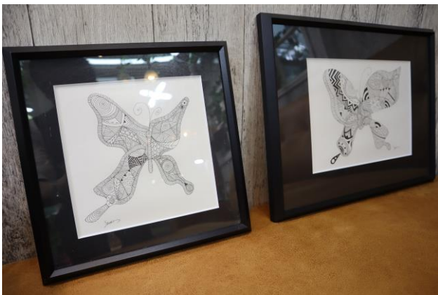
展示・販売するアート