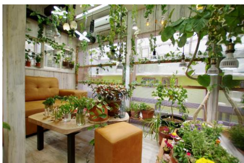
テラスは年中温室

メディア向け内覧会申込み用URL： https://forms.gle/9KDLzJmLYNp7MJuH6