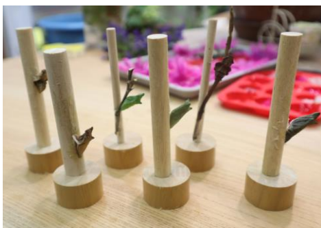
目の前で蝶の羽化を目撃するチャンスも