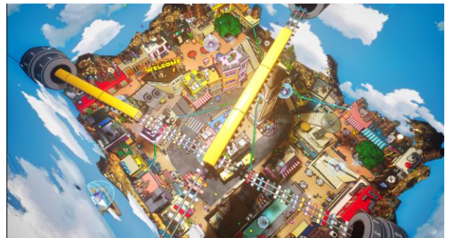
鍵を集めるチームと、それを阻むチームに分かれて遊ぶステージ「みらいのたからばこ」