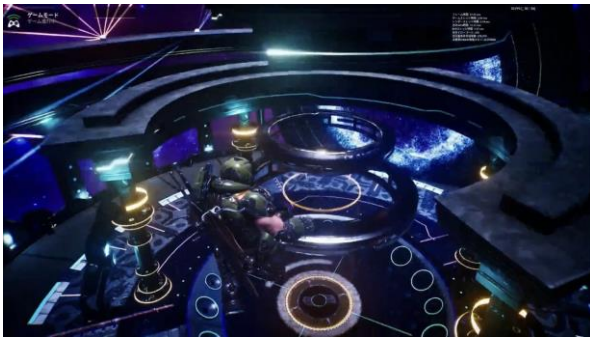
宇宙空間をイメージしたライブステージ