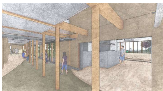
宿泊施設・広間を見る