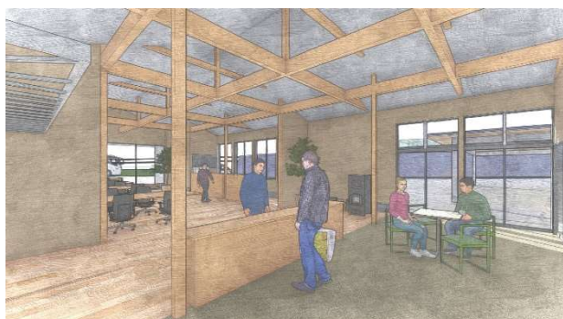
流通施設と土間続きのオフィス