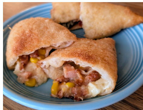
ピザ生地に具材を包んで揚げる イタリアのソウルフード 揚げピザ

(1)マルゲリータ(=幸運を呼ぶ)赤(トマト)・白(チーズ)・緑(バジル)は、“幸運を呼ぶ色”としてイタリアでは定番のシンボル。(2)揚げピザ(=運気をアゲル)“運気をアゲル”縁起食として、ラストスパートを後押し。(3)チーズたっぷり(=願いを結ぶ)伸びるチーズが“良縁を結ぶ糸”を象徴。(4)テリヤキチキン(=勝利をトリに)“チキン=幸運をトリこむ”“勝利を取りに行く”というゲン担ぎ。幸運を呼び込み、運をアゲ、願いを結び、勝利をトリに行く、四つの縁起をそろえた応援ピザセットです。