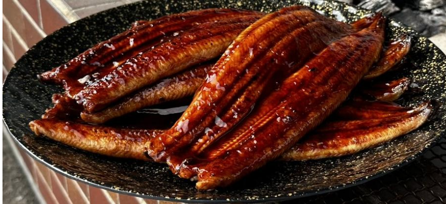
(提供する食べ放題のうなぎ)