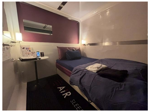
リカバリーをサポートする寝具を体験できる「First Class Air」

客室には、宿泊施設初導入となるマットレス【エアークネクトド】をはじめ、マットレスシーツ、掛ふとんカバー、まくら、まくらカバーといった【エアー】シリーズの寝具一式を導入。館内着として、男性は【エアーリカバリー】スリープテック（＊1）ウエアを、女性には化粧品としての効果も期待できるコスメティックスナイトウエア【newmine（ニューミン）】をご用意しています。旅先の疲れを癒すのはもちろん、購入を検討されている方には、高額な商品だからこそ自分に合うのか一晩寝てじっくりとご体感いただけます。