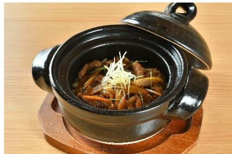
和牛とごぼうの土鍋ご飯 1,408円(税込)