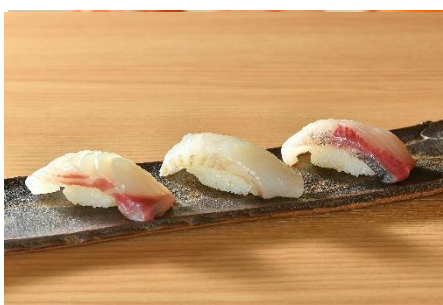
白身握り3種盛り 715円(税込)