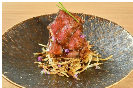
黒毛和牛ロース山椒焼き 1,408円(税込)