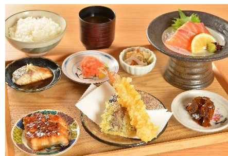
天寿し彩りおかず定食 1,628円(税込)