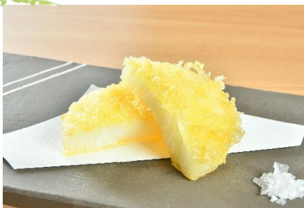
天ぷら 165円(税込) ~