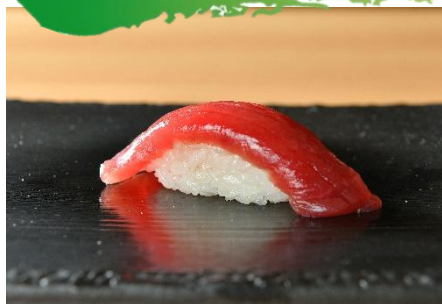
寿司(1貫)110円(税込) ~ ※写真はまぐろ 308円(税込)