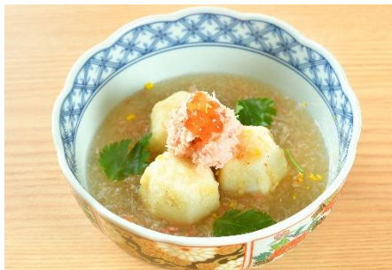
里芋蟹あんかけ 660円(税込)