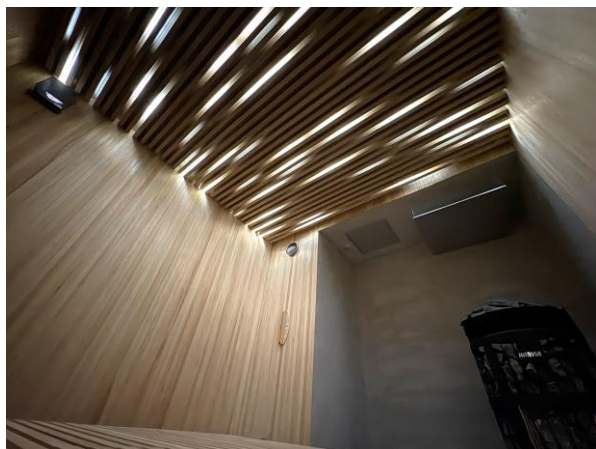
光と音を組み合わせたサウナ

https://www.prdesse.com/posts/view/22217