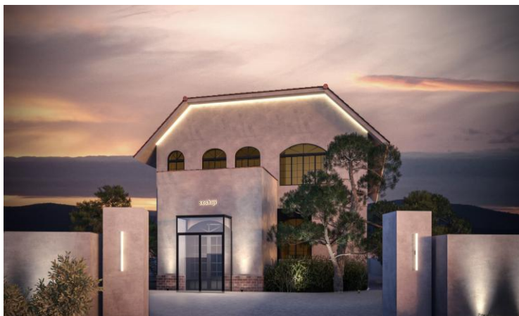
洋館をフルリノベーション