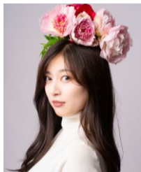
南侑里×フラチーム フラダンスパフォーマンス