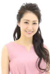
田中梨乃 タレント・女優 劇酒師