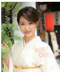
吉川亜樹 タレント・女優 日本酒学講師