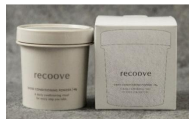
recoove Shoes Conditioning Powder