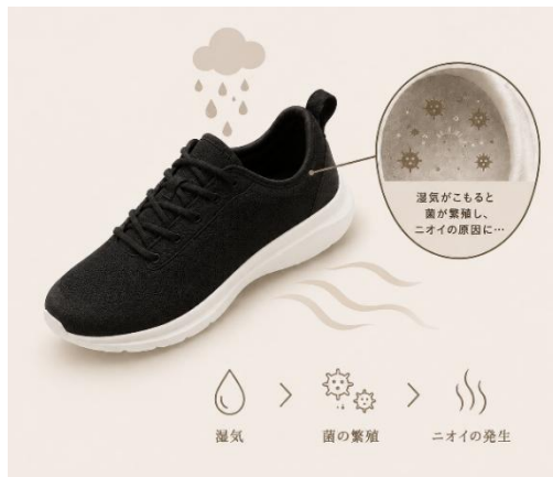
靴のニオイは“湿気”から始まる

近年では、「汗そのもの」ではなく、“湿気によって繁殖した菌”がニオイの原因になることも知られており、高温多湿になりやすいスポーツシューズ内部の環境対策が注目されています。