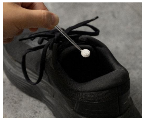
パウダーで整える、スポーツシューズの足元環境

湿気・ムレ・ニオイに着目した「シューズコンディショニング」という新しいスポーツ習慣を提案します。