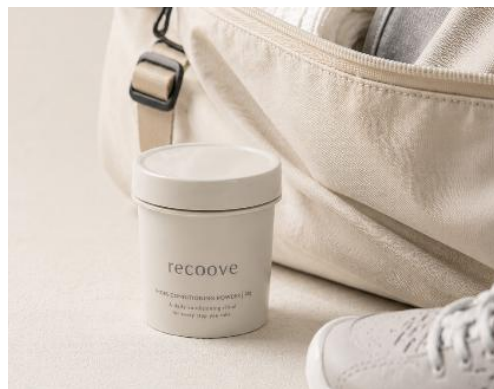
第1弾商品「recoove Shoes Conditioning Powder」