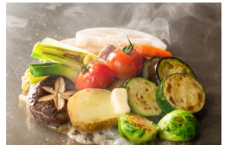
旬野菜の鉄板焼き

前菜1種、サラダ、メイン（旬魚鉄板焼きorすき焼きそば）、土鍋ご飯、味噌汁、漬物