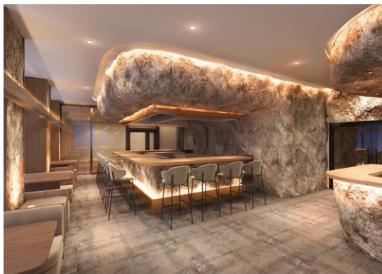
マーブル模様を基調にしたモダンな店内