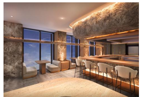
「大坂鉄板焼 鉄十」店内イメージ

公式インスタグラム： https://www.instagram.com/tetsuju.yodoyabashi/