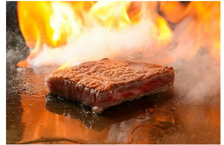
豪快かつ繊細に焼き上げるステーキ

前菜3種、旬魚旬菜のココット、名物すき焼きそば、お口直し、旬野菜の鉄板焼き、アワビのステーキ、厳選黒毛和牛フィレステーキ、ガーリックライスとお味噌汁、今月の特製デザート