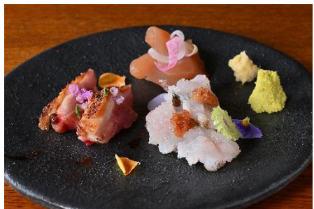
地鶏二種と旬魚の造り盛り合わせ 2,200円(税込)