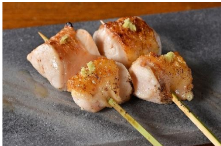
串焼き(1本)418円(税込)～ ※写真は熊野地鶏の胸焼き