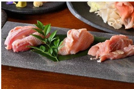
地鶏の炭火七輪焼き 1種 1,078円(税込)～