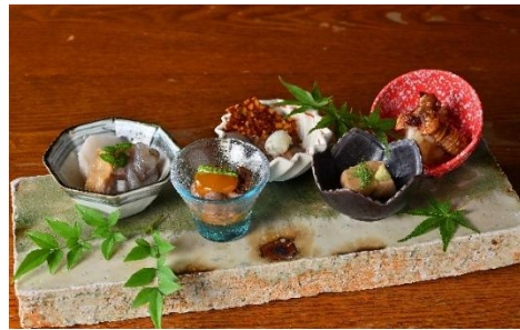
878前菜盛り合わせ 1,408円(税込)～