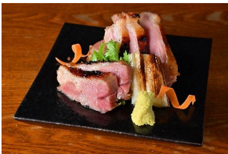
炭火で焼き上げた合鴨もも肉と焼き白ネギ 1,760円(税込)