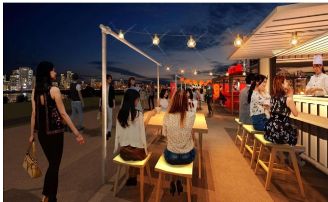
「淀川つつみ市 ミナモ十三」屋台エリア イメージ

前回のプレスリリース https://www.prdesse.com/posts/view/21399