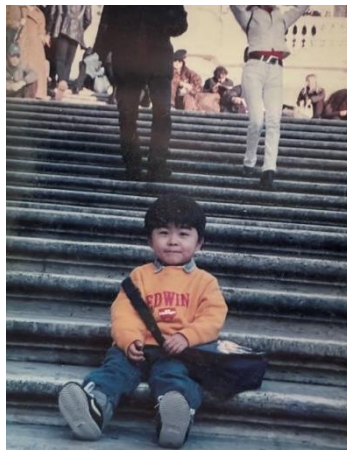
4歳頃の四方少年がイタリア視察