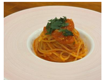
復刻「親父のポモドーロ」