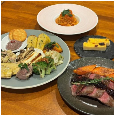
「屋台イタリアン復刻コース」の一部 ※前菜とメインは2人前